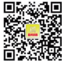
嘉兴楼市官方微信

2017年本报房产专家咨询团投诉解答继续期待与您互动解答您的投诉疑问。如果你正在对楼市行情感到迷茫,或者是对相中的楼盘户型难下决心,或者是房产方面的专业知识、法律问题想要咨询,或者是只是想吐槽一下,都欢迎你加入广电报房产专家咨询团。QQ群号:195078736。除了常规即时答疑,每周五上午9点30分至11点,更有不同专家坐镇解惑。扫描右侧嘉兴楼市二维码,亦可提前获悉本地楼市资讯和专家咨询互动反馈。